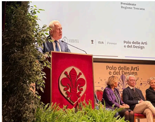
Giani all'inaugurazione dell'anno accademico del Polo delle Arti e del Design

È stato inaugurato questa mattina con una cerimonia al Teatro Niccolini di Firenze il nuovo anno accademico 2025-2026 del Polo delle Arti e del Design di Firenze , una realtà di Alta Formazione Artistica, Musicale e Coreutica, nata alcuni anni fa riunendo tre diversi istituti fiorentini AFAM: l'Accademia delle Belle Arti di Firenze, il Conservatorio "Luigi Cherubini" e l'Istituto superiore per le industrie artistiche di Firenze.