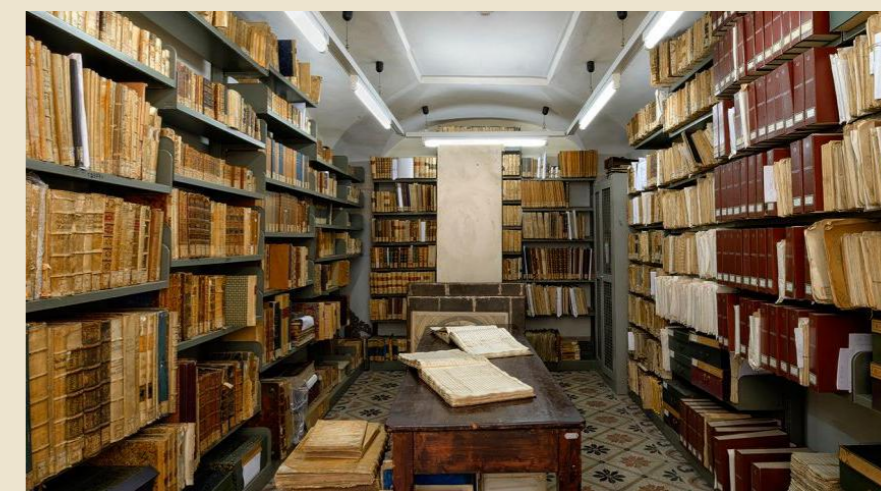
Biblioteca del Conservatorio Cherubini ▲

Musiche di Giulio Briccialdi e Cesare Ciardi